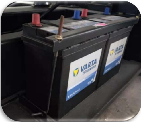
角铁条斜拉式固定法